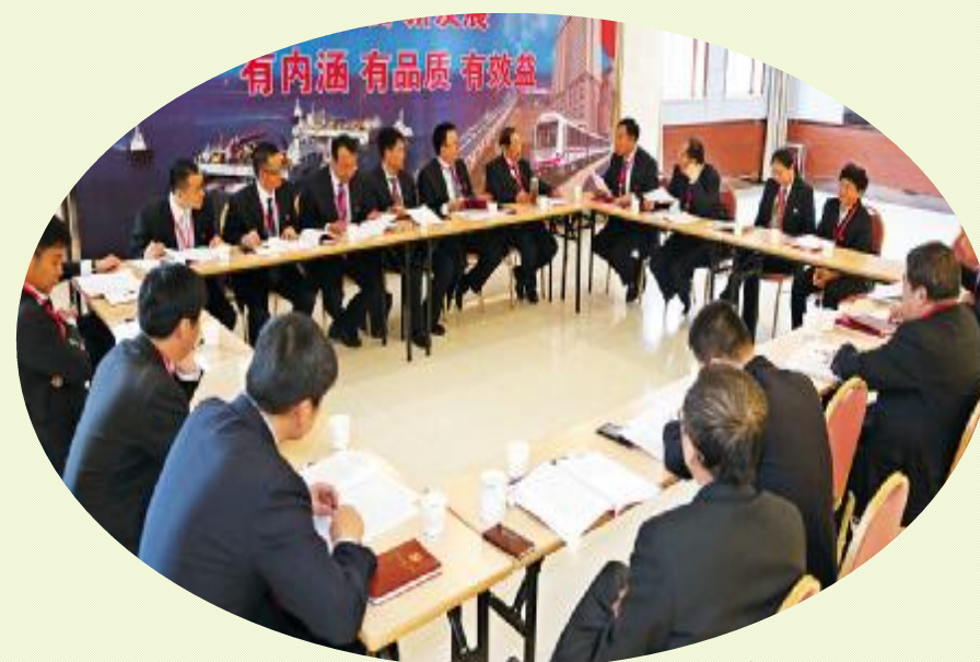
▲ 围绕两委工作报告及报告决议（草案），各代表组展开热烈讨论