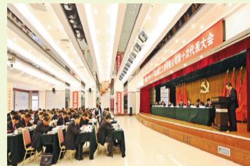
▲ 全体代表认真听取第九届党委工作报告