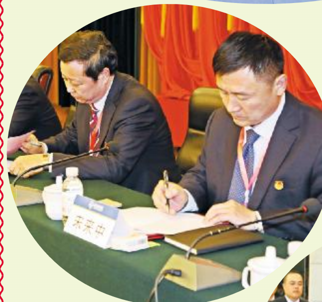
▲ 认真选举公司第十届党委会、第七届纪委会人选