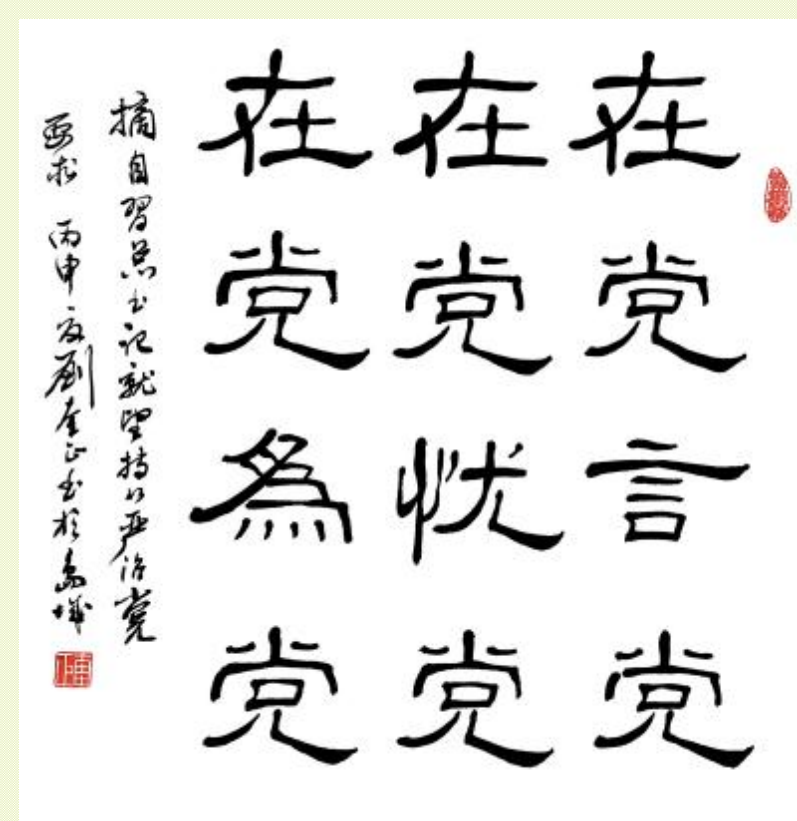
书法 / 刘奎正