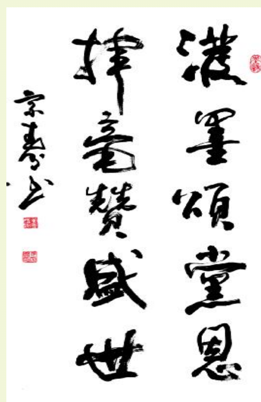
书法 / 于宗寿