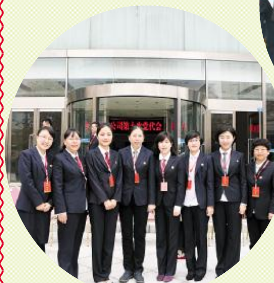
▲ 公司第十次党代会女代表合影