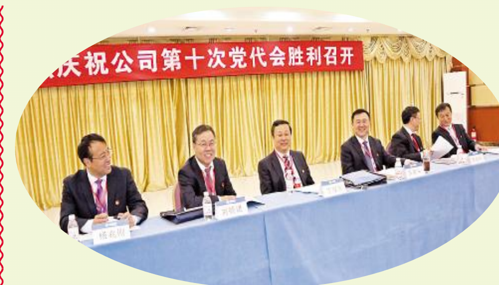
▲ 召开主席团第一次会议，明确任务、通过代表资格审查报告等