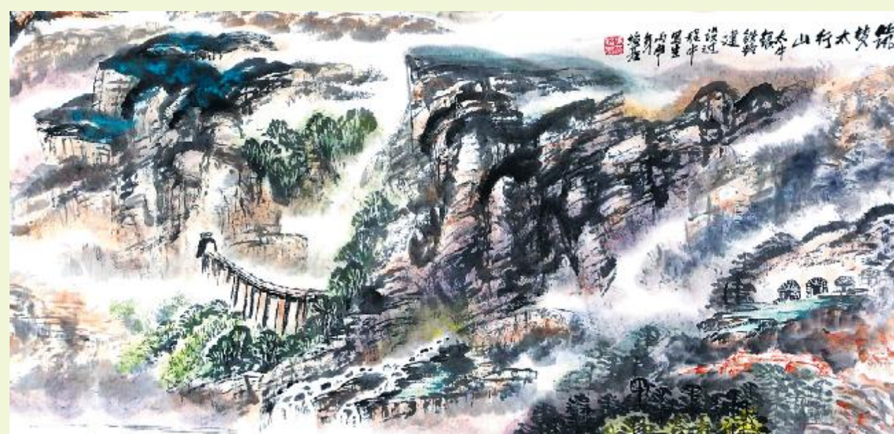
国画 / 冯绍基