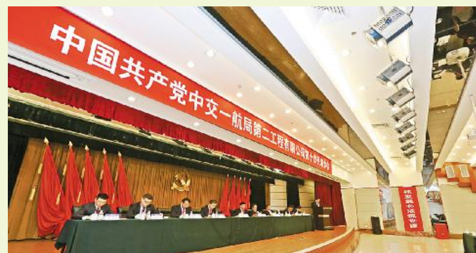
▲ 大会开幕，图为主席团