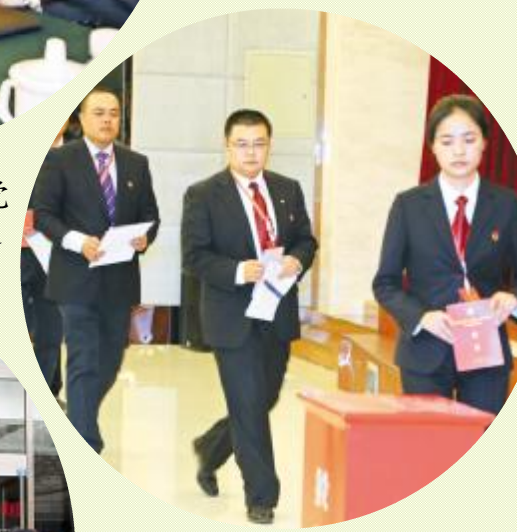
▲ 投票选举公司第十届党委会、第七届纪委会人选