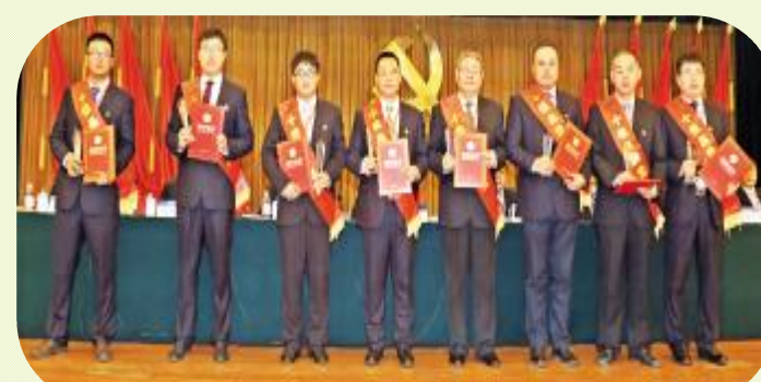
▲ 集团、局先进集体和个人，公司先进基层党组织、十佳品牌党员等接受表彰