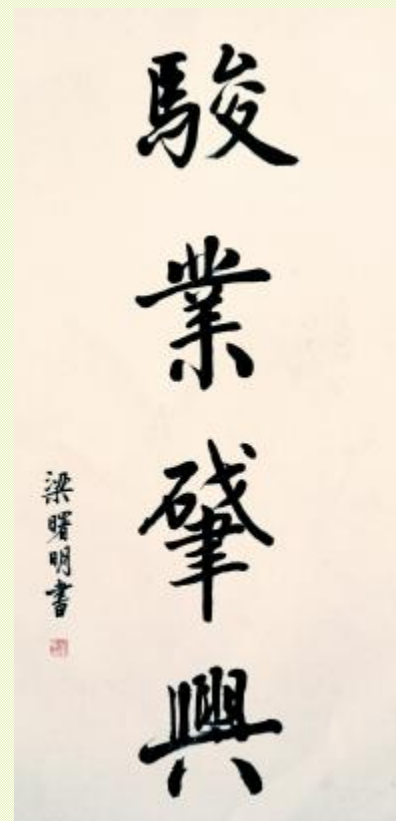
书法 / 梁曙明