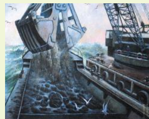
油画 / 董良音