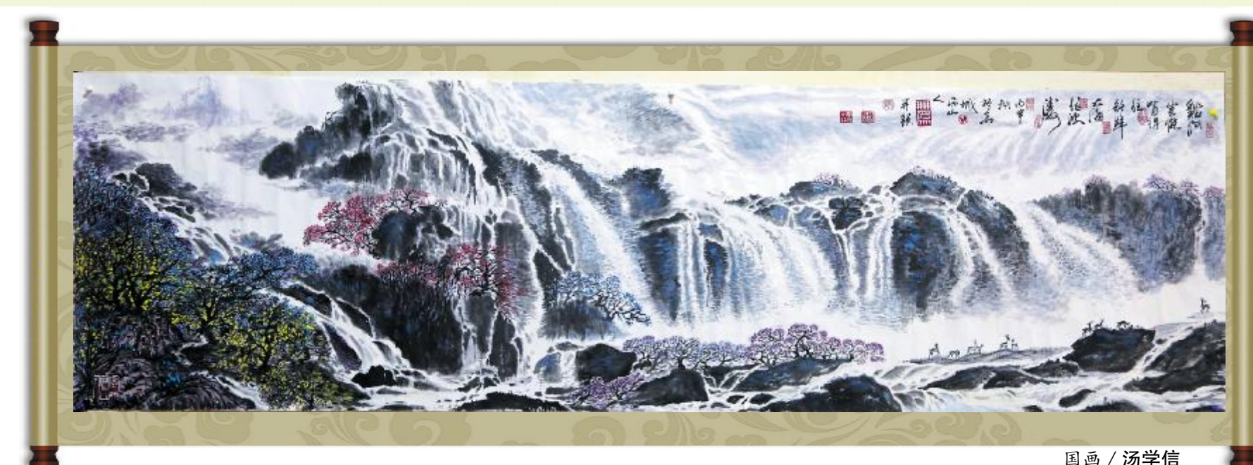
国画 / 汤学信

我歌唱未来 我歌唱希望 我歌唱企业成长的伟大历程 我歌唱筑港人不屈的坚强脊梁 我歌唱企业美好的明天 我歌唱百年梦的伟大畅想