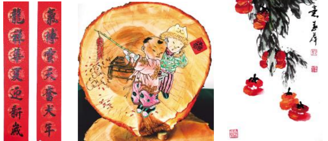
书法 付乐 书画 陈红苗 国画 事事如意 刘春萍