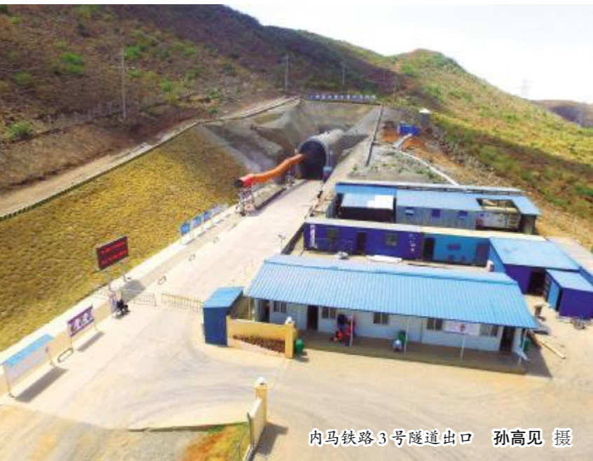
内马铁路3号隧道出口

另外，当地工会非常重视工人权益的维护，不断提出新的要求，甚至以组织罢工施压。与此同时，2017年肯尼亚总统两次大选，也因各种原因发生几次罢工事件。掌握了当地这两种情况之后，郑建国他们有针对性地加强对肯尼亚工人的关心，在劳保用品、休息休假等