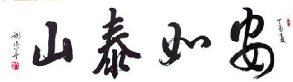
▲ 书法 邢伟华