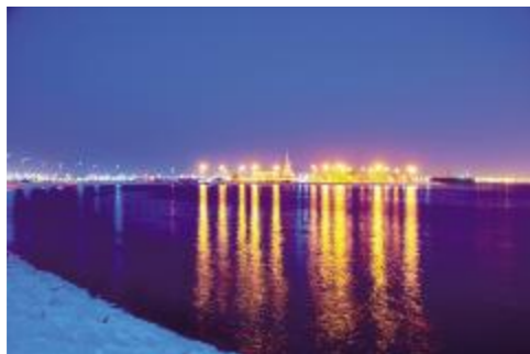
▲ 沙特珊瑚岛夜景

编者按 公司开展“扬帆新时代”主题创作月以来,广大文艺爱好者踊跃参与,精心创作,编辑部收到了大量作品,本期继续选登部分优秀作品,以飨读者。