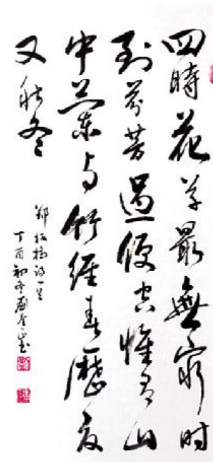
▲ 书法 刘奎正