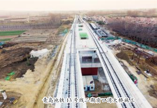
青岛地铁13号线二期黄口湾大桥施工

Y形墩柱,线形美观,节约空间,与直立式墩柱相比优点突出,但对模板及混凝土质量也提出了更高的要求。