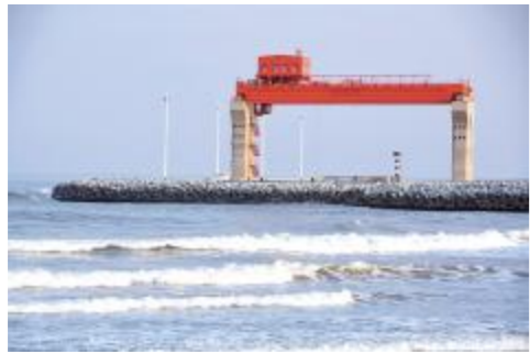
▲ 浪奔浪流