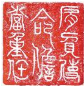
肩负使命 担当重任