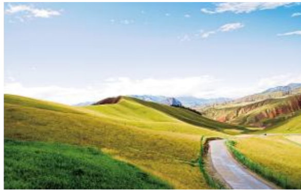
▲ 通向远方