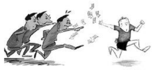
漫画 讨债 峰君