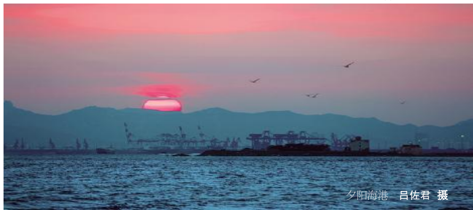
夕阳海港

是一幅泼墨山水的国画,或许是一卷逸不凡的书法,也可能是一篇洋洋大观的篇章。种子既已种下,他日定会成长。