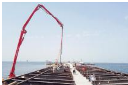
7月24日,由中国港湾承建,公司参建的阿美钱桥项目新建钱桥主体工程全部完工,该桥长408米,宽11.9米。