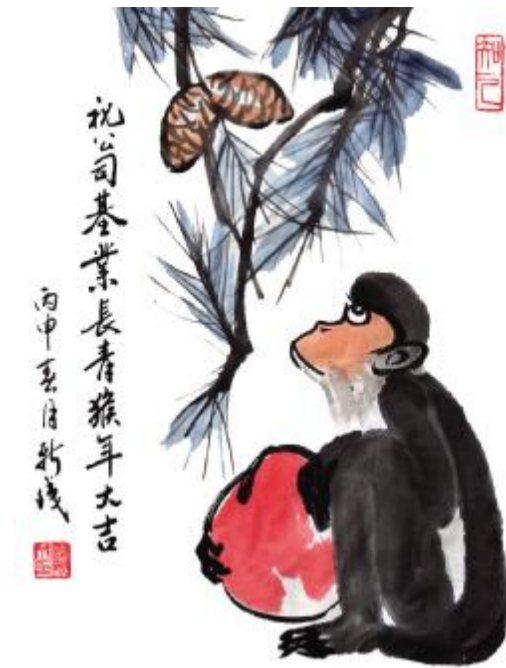
祝公司基业长青猴年大吉